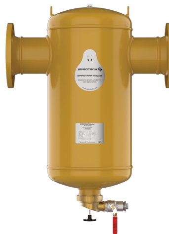
Image du produit